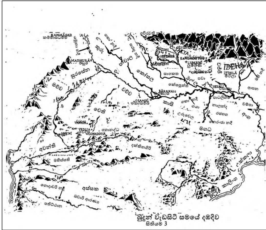
Map4: Ancient India by Sutta Central